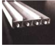
4х-канальный карниз 81*17 мм